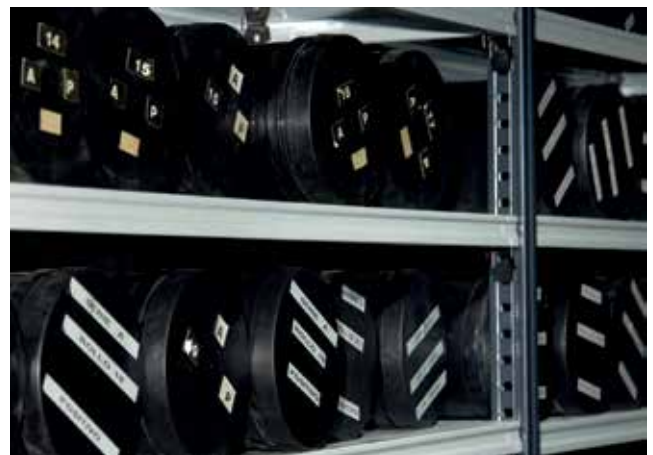
Figura 2. Rollos Serie A (1946)