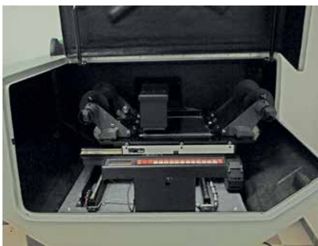
Figura 7. Escáner Leica DSW600