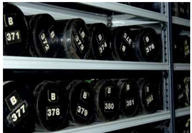
Figura 3. Rollos Serie B (1956)