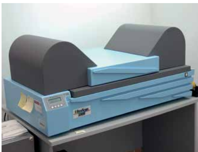
Figura 8. Escáner Vexcell UltraScan 5000

Todas estas fotografías se encuentran a disposición de las personas que las necesiten. Pueden conseguirlas mediante una petición al CECAF, tras la cual se hace un expediente de trabajo, tras ser abonadas, son entregadas a sus peticionarios.