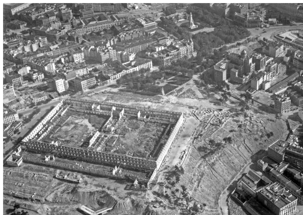
Figura 5. Vista Aérea Cuartel de la Montaña (Madrid, 1943)