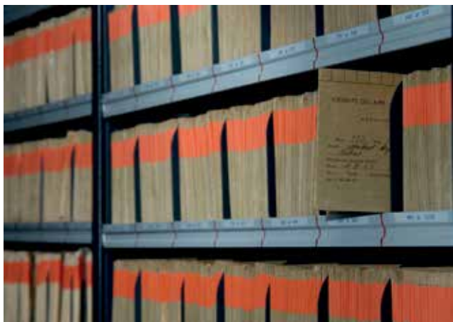
Figura 6. Placas de Cristal